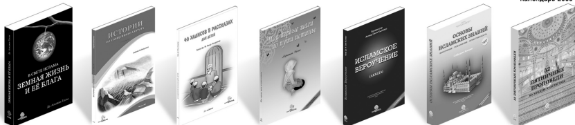
Земная жизнь и её блага