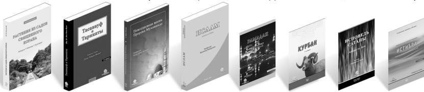
Растения из садов Священного Корана