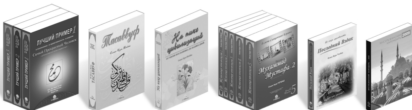
Лучший Пример - 1, 2, 3