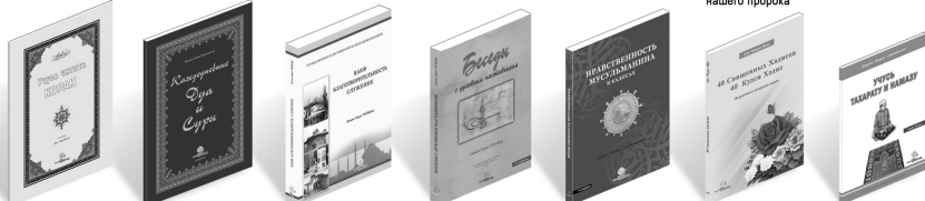
Учусь читать Коран